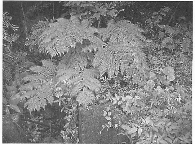
Angiopteris lygodiiifolia リュウビンタイ