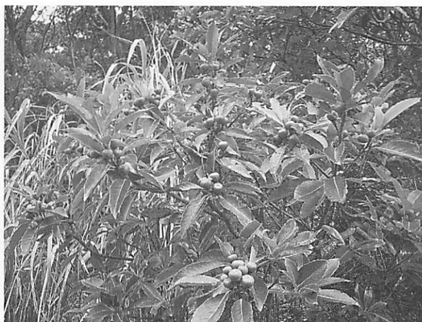
Schima wallichii ssp. Liukuensis イジュ