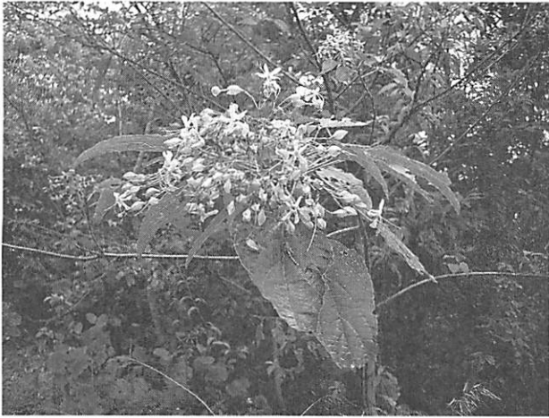
Clerodendron trichotomum var. esculentum ショウロウクサギ