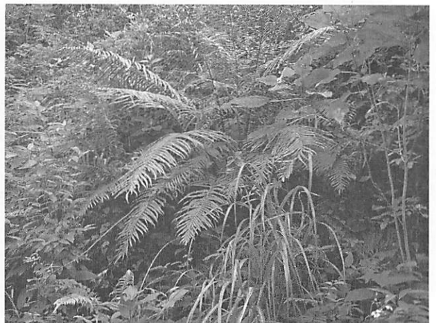
Blechnum orientale ヒリュウシダ