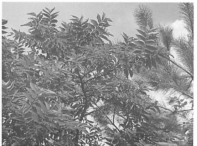
Trema orientalis ウラジロエノキ