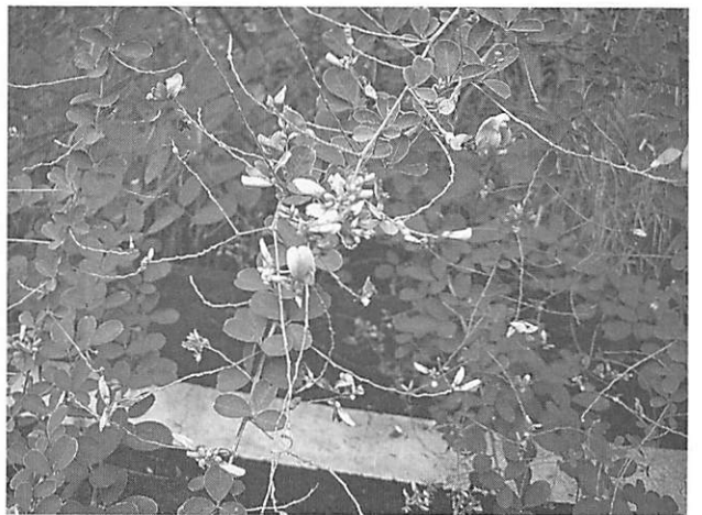
Lespedeza bicolor ヤマハギ