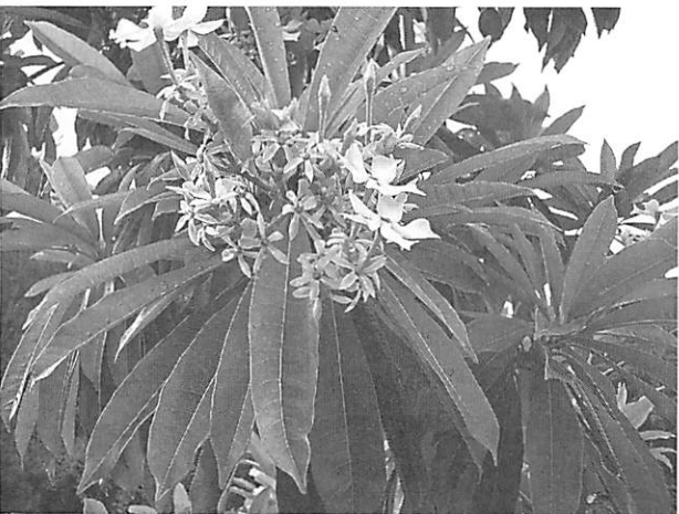
Cerbera manghas ミフクラギ