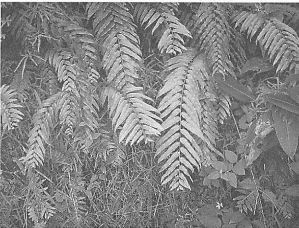
Nephrolepis biserrata ホウビカンジュ