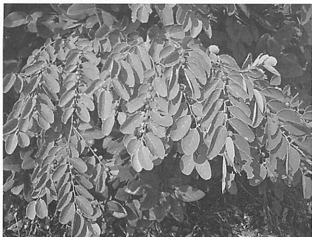
Breynia officinalis オオシマコバンノキ