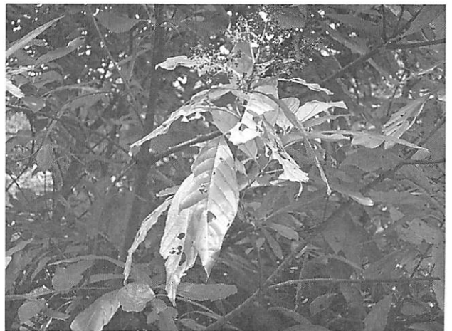
Wendlandia formosana アカミズキ