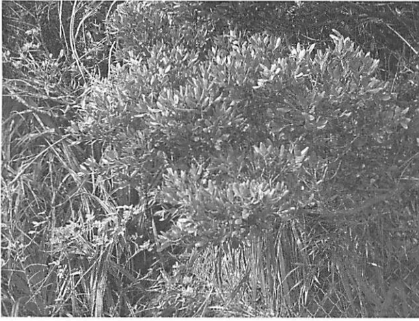
Cinnamomum doederleinii シバニッケイ