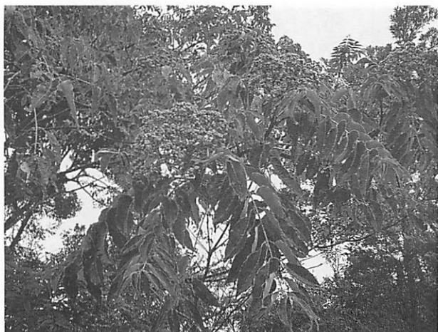
Euodia meliifolia ハマセンダン