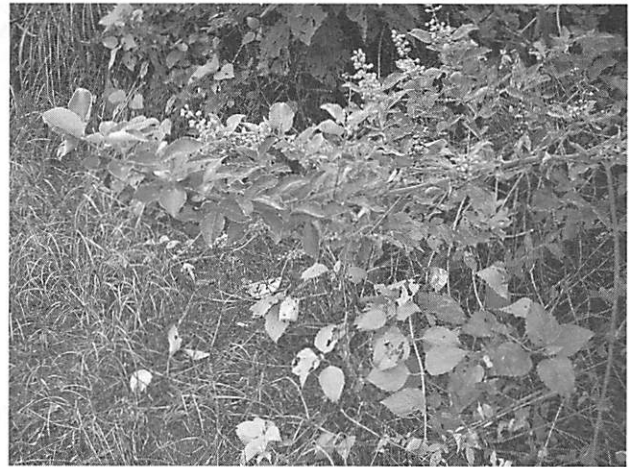
Vitex trifolia ミツバハマゴウ