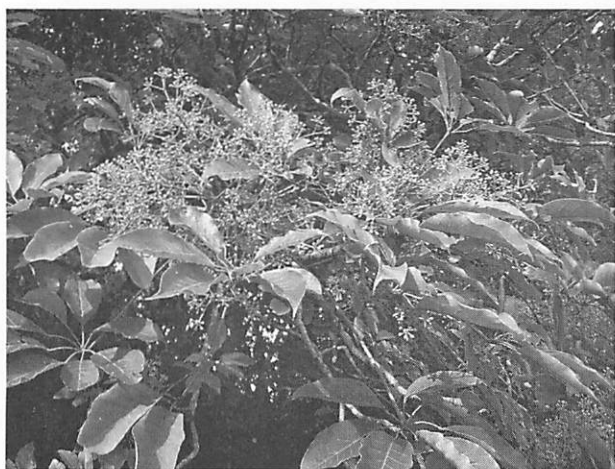
Schefflera octophylla フカノキ