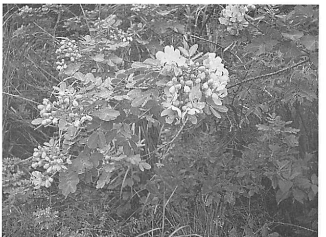
Cassia coluteoides ハマセンナ