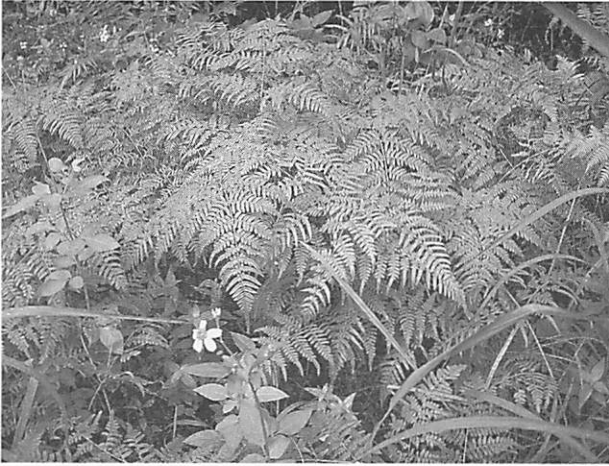
Pteridium aquilinum var. latiusculum ワラビ