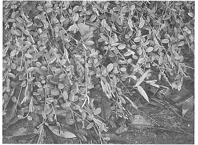
Alysicarpus vaginalis ササハギ (マルバダケハギ)