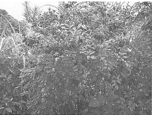
Maackia tashiroi シマエンジュ