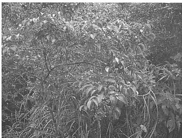
Euscaphis japonica ゴンズイ