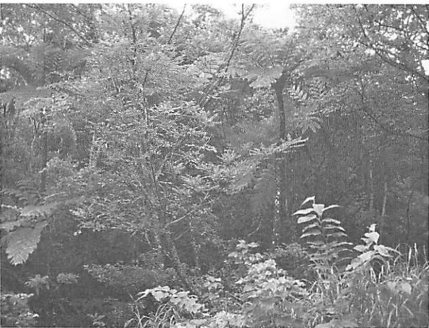
Cyathea lepifera Copel. ヒカゲヘゴ