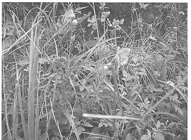
Platycodon grandiflorum キキョウ