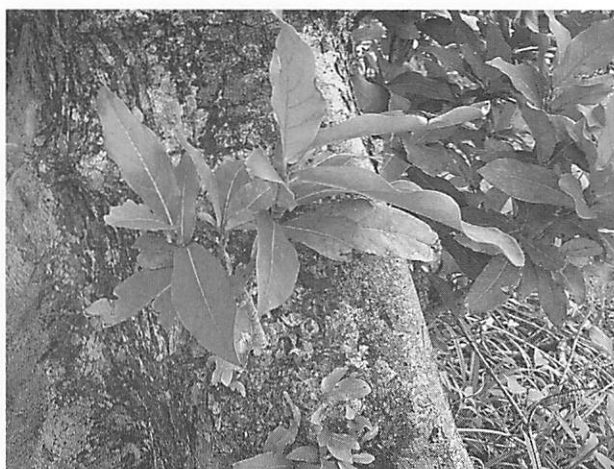
Heritiera littoralis サキシマスホウノキ