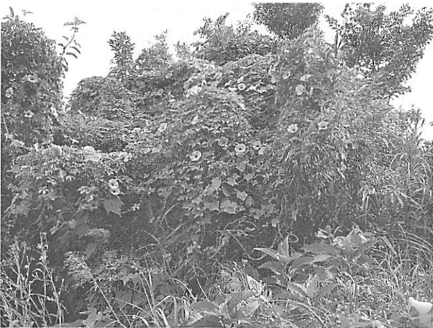
Ipomoea cairica モミジバヒルガオ