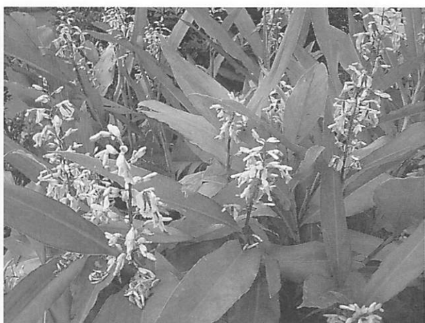
Alpinia formosana クマタケラン