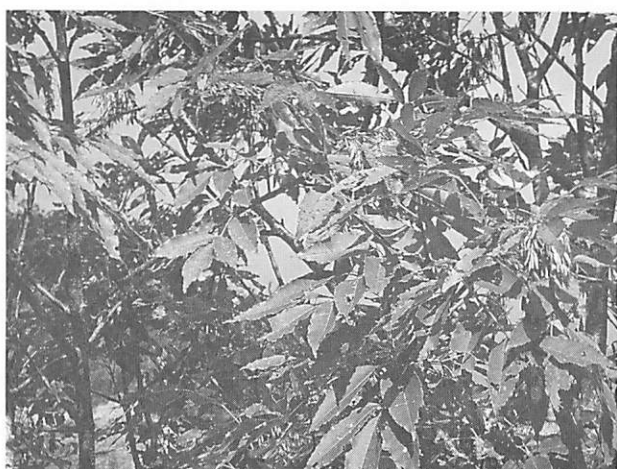
Fraxinus floribunda シマタゴ