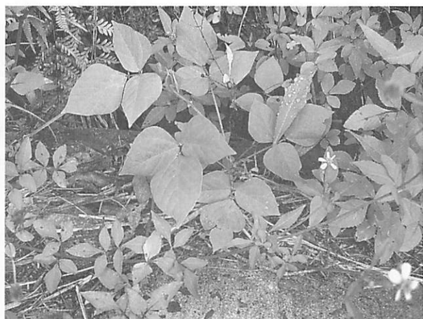
Desmodium laterale リュウキュウスズビトハギ