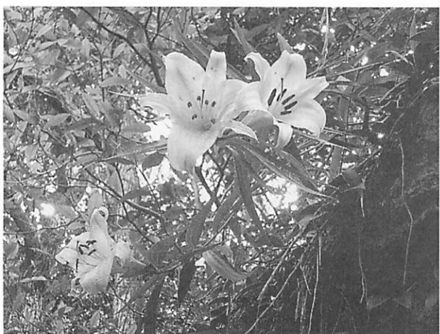
Lilium alexandrae ウケユリ