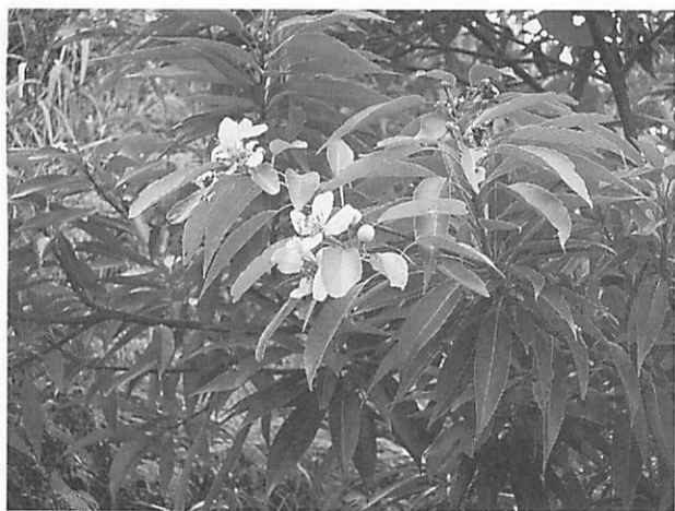
Schima wallichii ssp. Liukiuensis イジュ