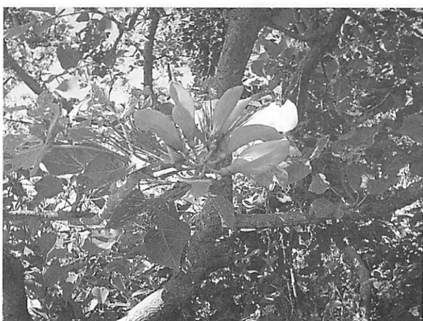
Erythrina variegata var. orientalis デイコ