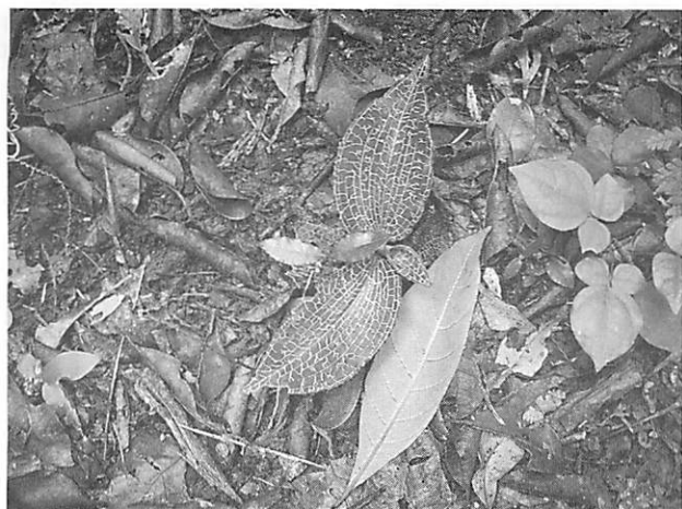
Goodyera hachijoensis var. matsumurana カゴメラン