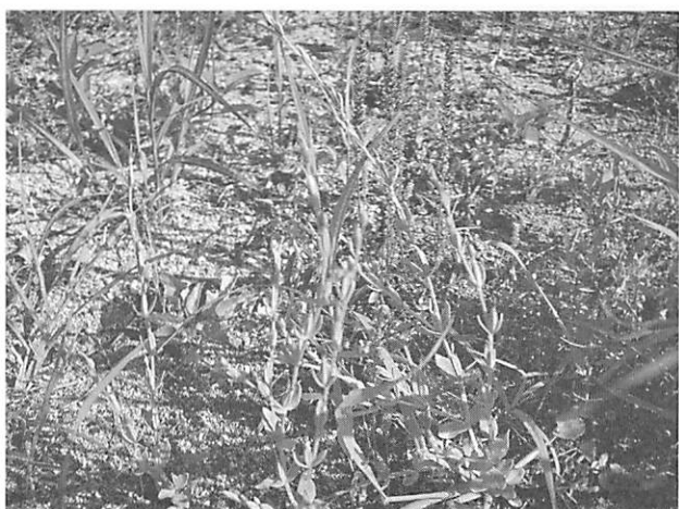
Centaureum japonicum ホウライセンブリ