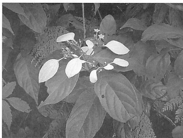
Mussaenda parviflora コンロンカ