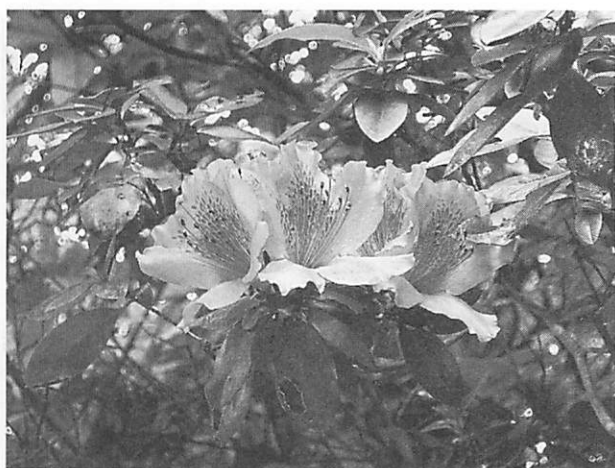
Rhododendron simsii タイワンヤマツツジ