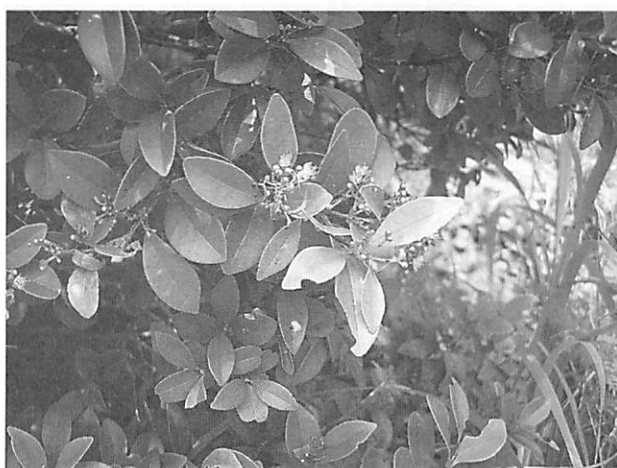
Syzygium buxifolium アデク