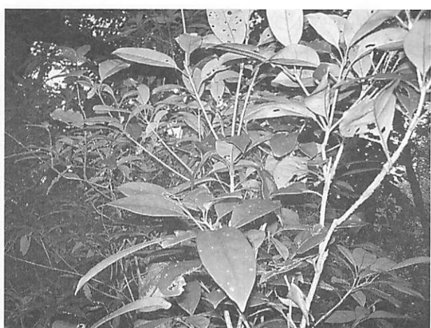
Osmanthus marginatus リュウキュウモクセイ