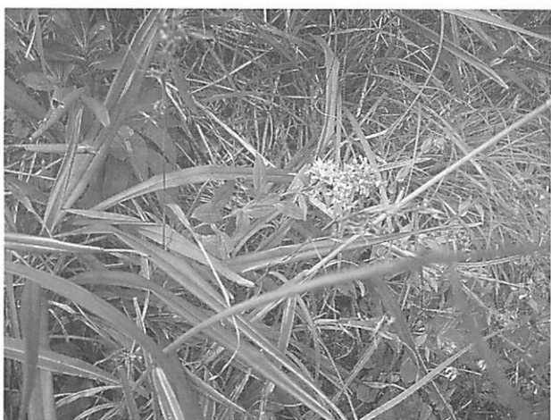
Solidago virga-aurea var. insularis シマコガネグク