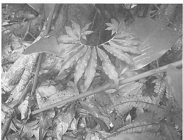
Arisaema heterocephalum アマミテンナンショウ