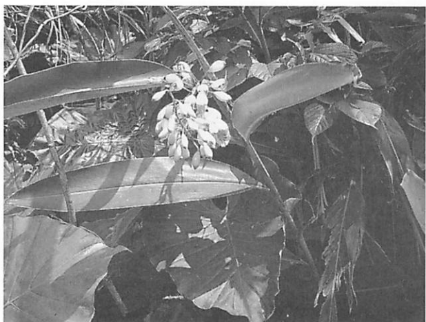
Alpinia speciosa ゲットウ