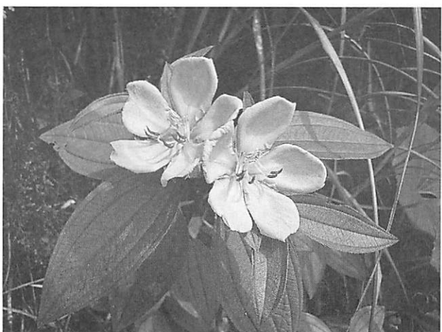
Melastoma candidum ノボタン