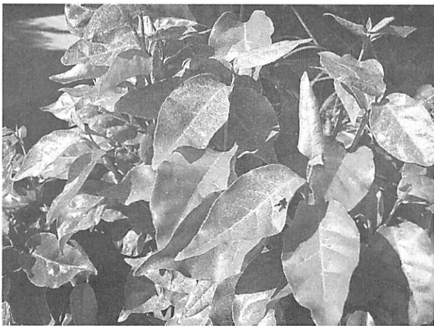
Elaeagnus macrophylla マルバグミ