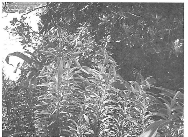
Lilium longiflorum テッポウユリ