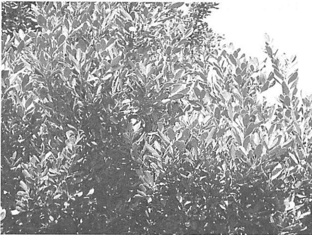
Cinnamomum daphnoides マルバニッケイ