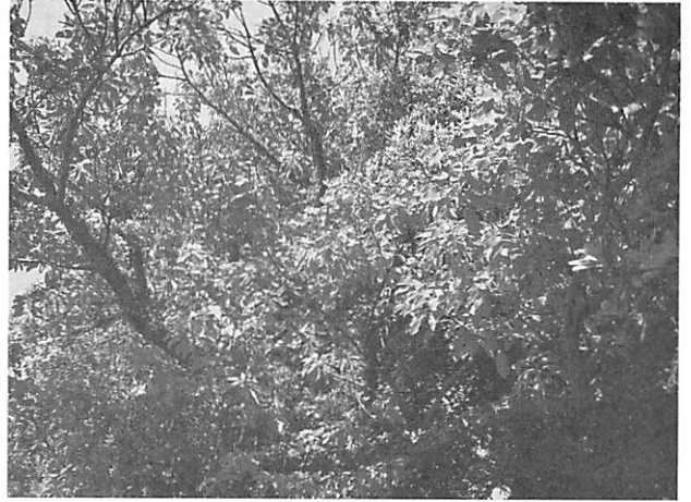
Ficus superba var. japonica アコウ