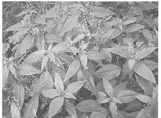
Mercurialis leiocarpa ヤマアイ