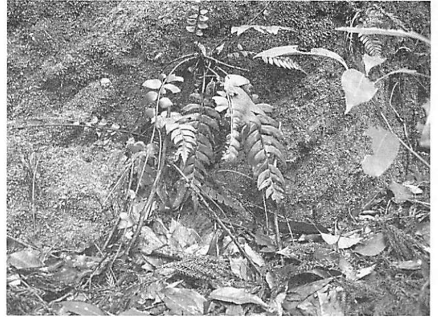
Polystichum lepidocaulon オリヅルシダ