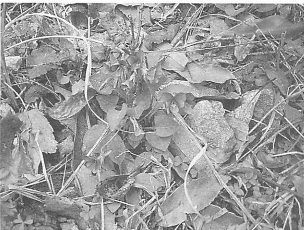
Viola phalacrocarpa アカネスミレ