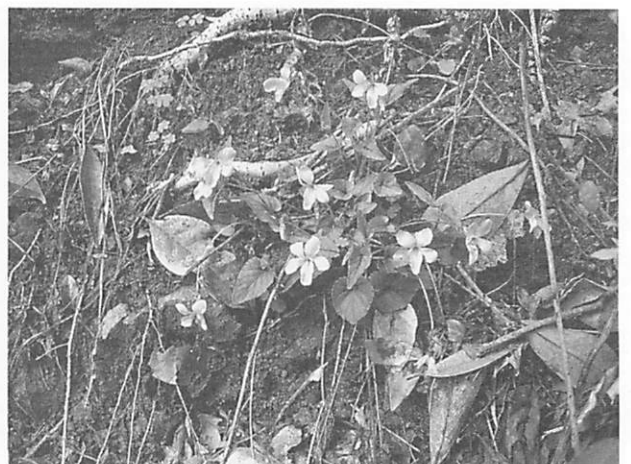
Viola ovato-oblonga ナガバノタチツボスミレ