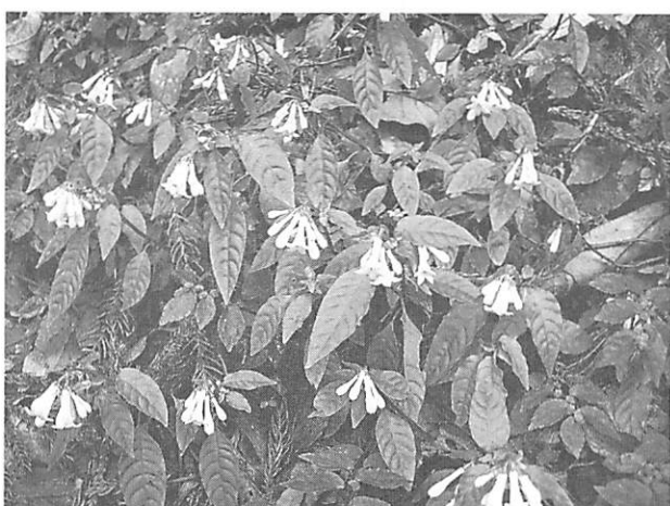
Ophiorrhiza japonica サツマイナモリ