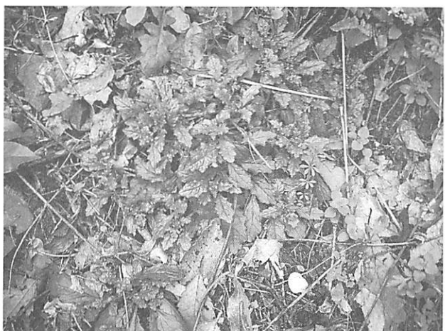
Ajuga decumbens キラソウ