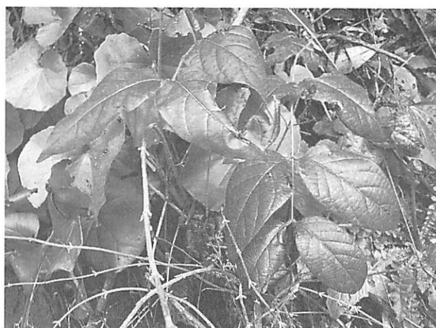
Lonicera hypoglauca キダチニンドウ