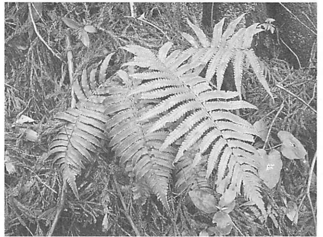
Dryopteris commixta ツクシイワヘゴ