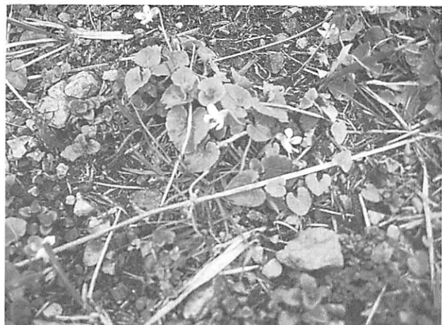
Viola sieboldii Maxim. フモトマスミレ