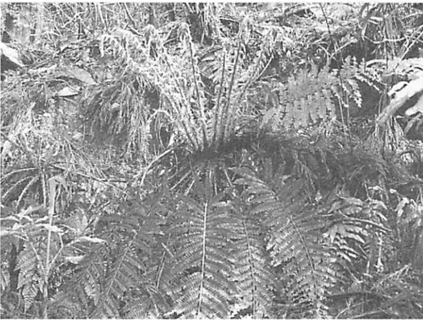
polystichum polyblepharum イノデ