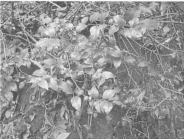
Xylosma congestum クスドイゲ