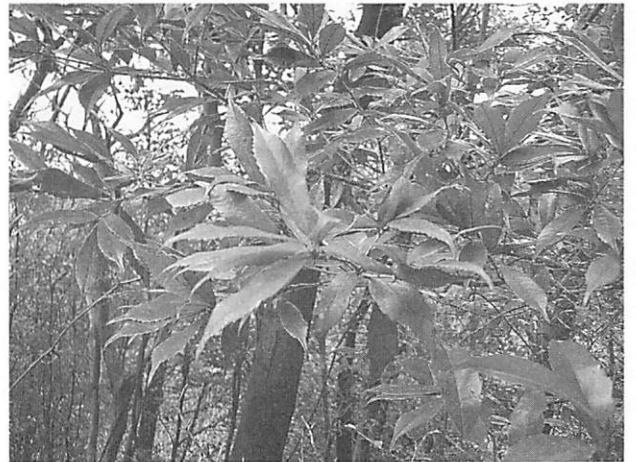
Quercus gilva イチイガシ