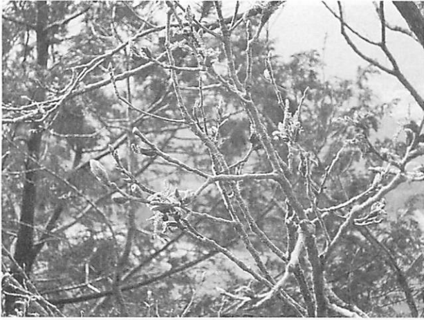
Quercus dentata カシワ