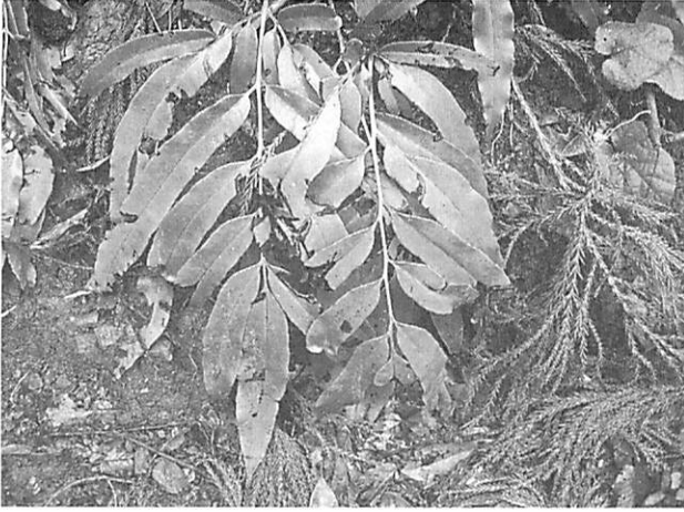
Coniogramme japonica イワガネソウ