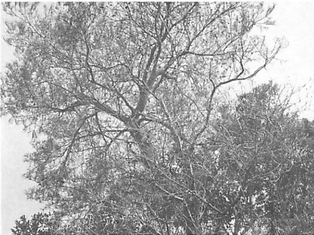
Pinus densiflora アカマツ