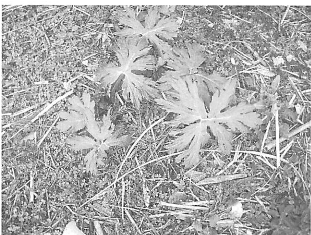
Ligularia japonica ハンカイソウ