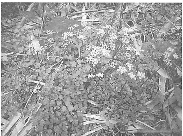
Chamaele decumbens セントウソウ