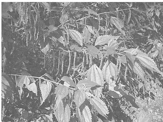
Boehmeria spicata コアカソ