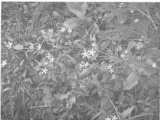
Swertia bimaculata アケボノソウ