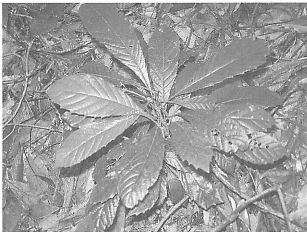
Meliosma rigida ヤマビワ