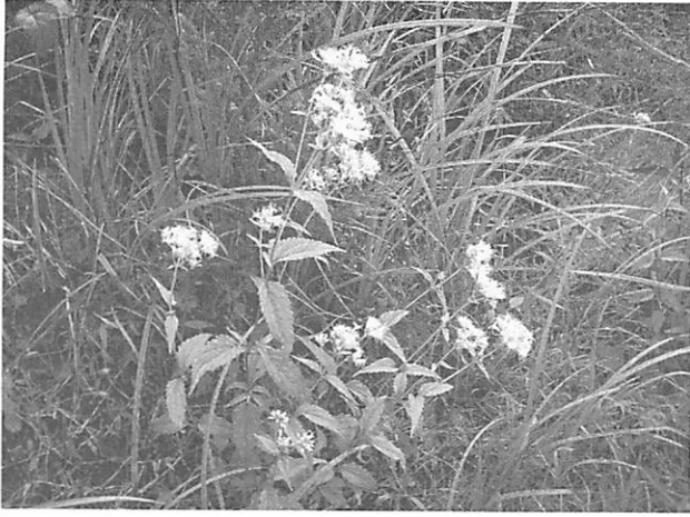
Eupatorium chinense var. oppositifolium ヒヨドリバナ