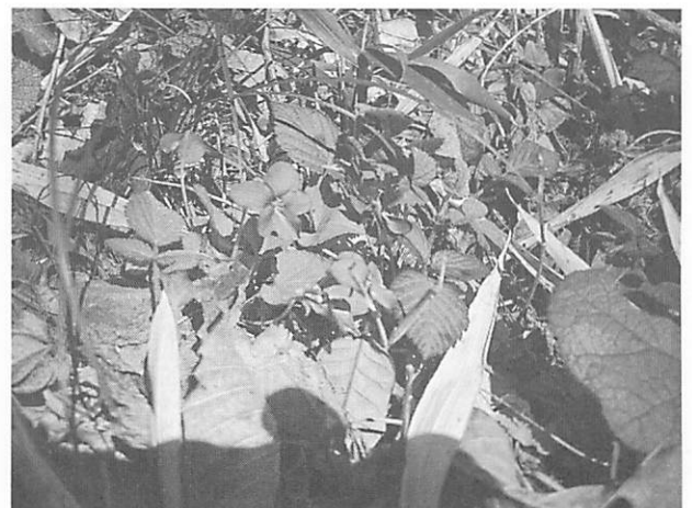
Viola phalacrocarpa アカネスミレ