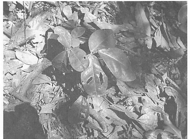
Euchresta japonica ミヤマトベラ