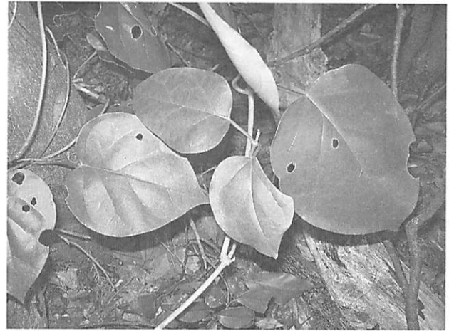
Marsdenia tomentosa キジョラン