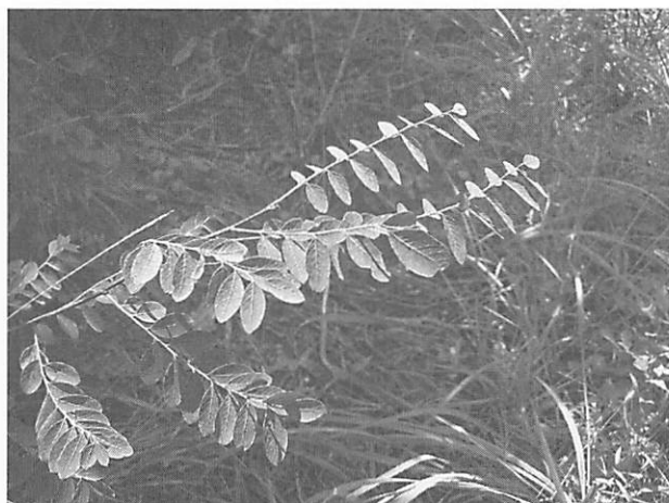
Phyllanthus flexuosus コバンノキ