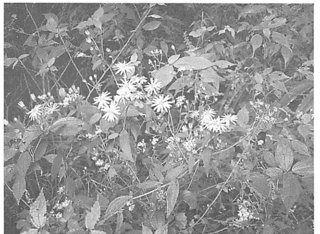
Aster satsumensis サツマシロギク