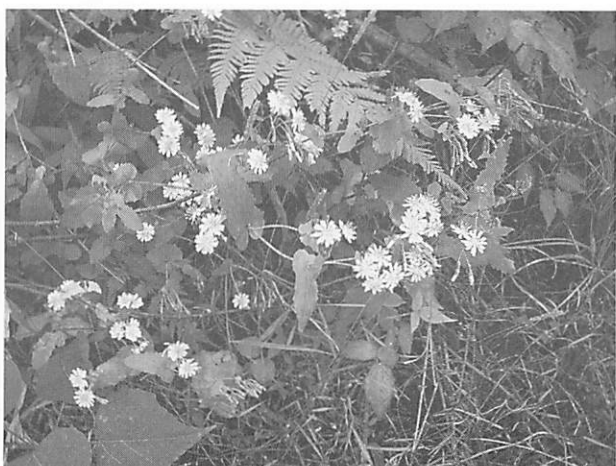
Youngia denticulate ヤクシソウ