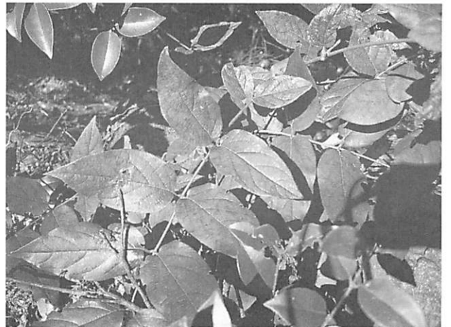
Lonicera hypoglauca キダチニンドウ