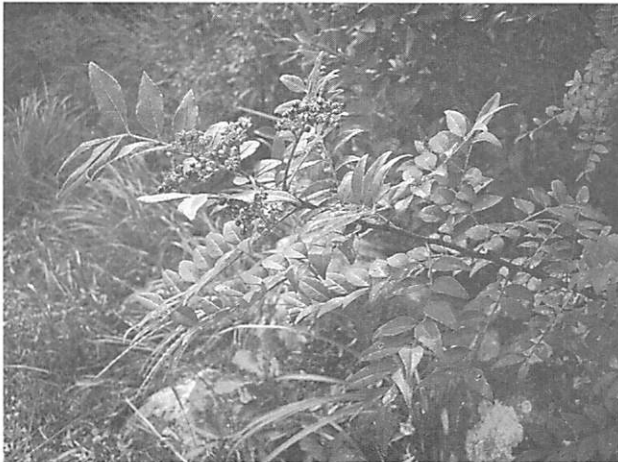
Zanthoxylum schinifolium イスザンショウ