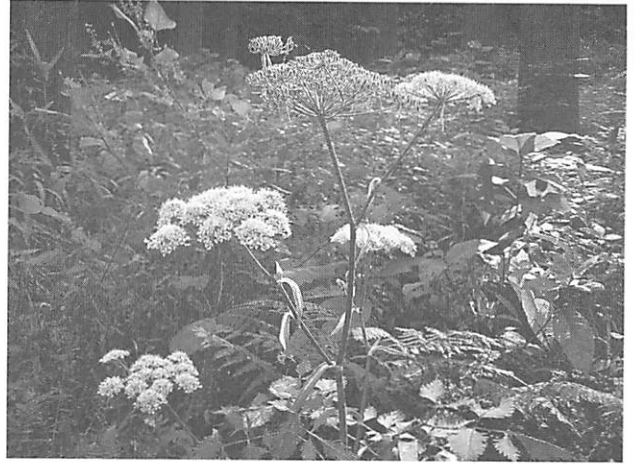
Angelica polymorpha シラネセンキュウ