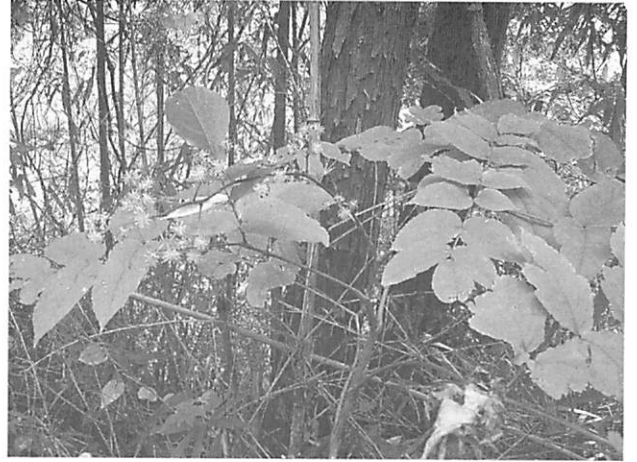
Aralia cordata ウド