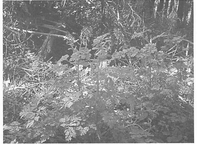
Corydalis incise ムラサキケマン