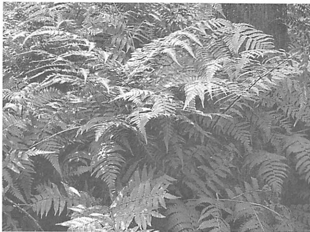
Diplazium hachijoense シロヤマシダ