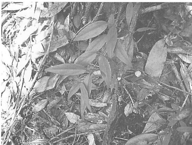
Tylophora japonica トキワカモメヅル