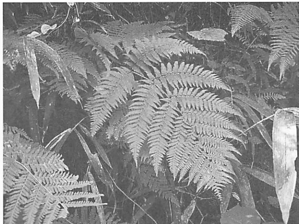
Thelypteris torresiana var. calvata ヒメワラビ