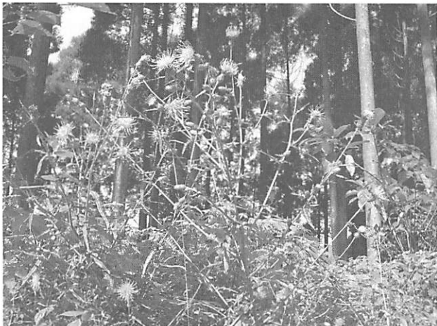
Cirsium buergeri ヒメヤマアザミ