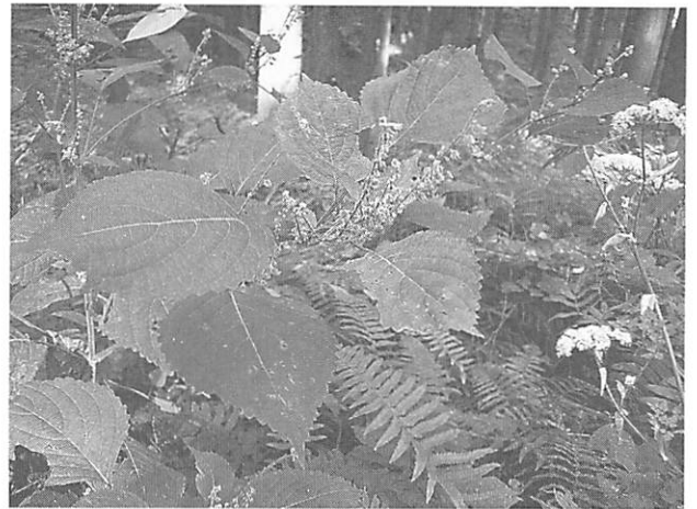
Perilla frutescens レモンエゴマ