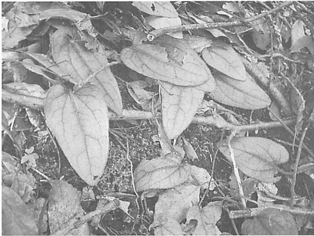
Ainsliaea fragrans var. integrifolia マルバテイショウソウ