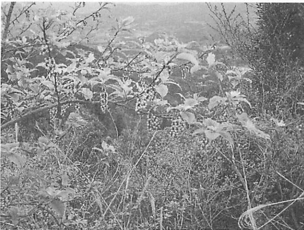
Stachyurus praecox キブシ