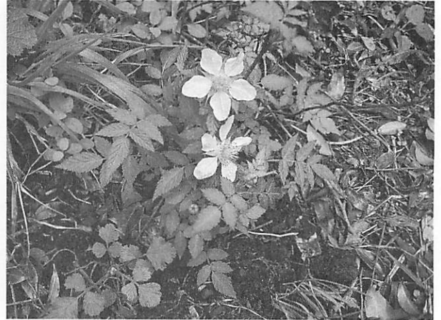
Rubus minusculus ヒメバライチゴ