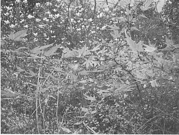
Rubus palmatus ナガバノモミジイチゴ