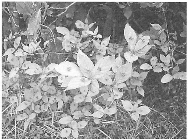
Helwingia japonica ハナイカタ