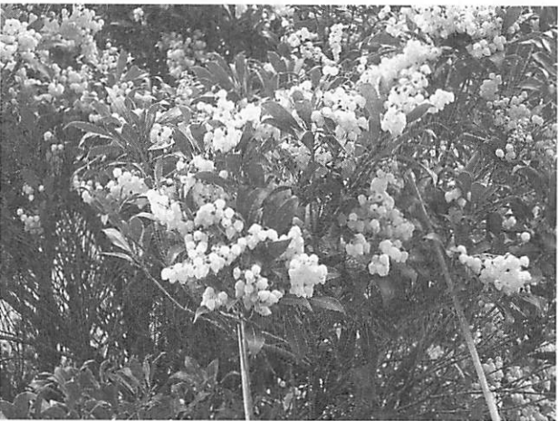
Pieris japonica アセビ