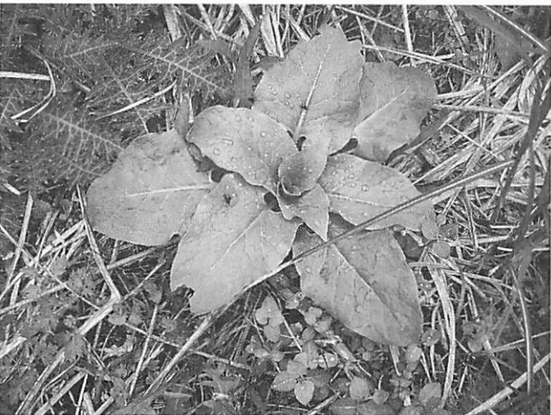
Lilium cordatum ウバユリ