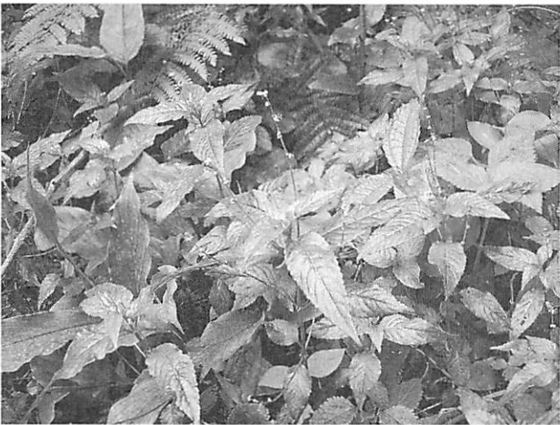
Mercurialis leiocarpa ヤマアイ