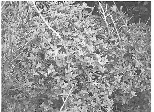
Abelia serrata コックバネウツギ