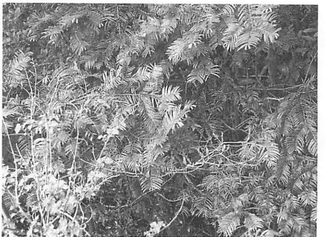
Cephalotaxus harringtonia イヌガヤ