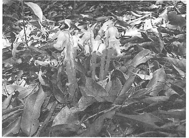
Monotropastrum humile var. tripetaum ギンリョウソウ