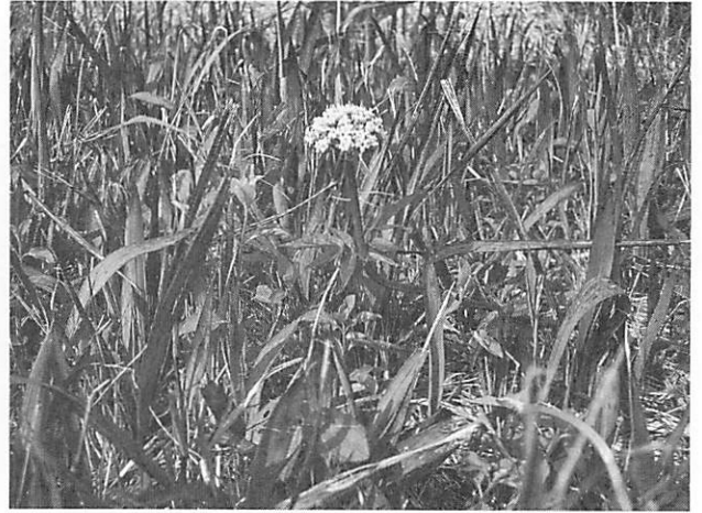
Valeriana fauriei カノコソウ