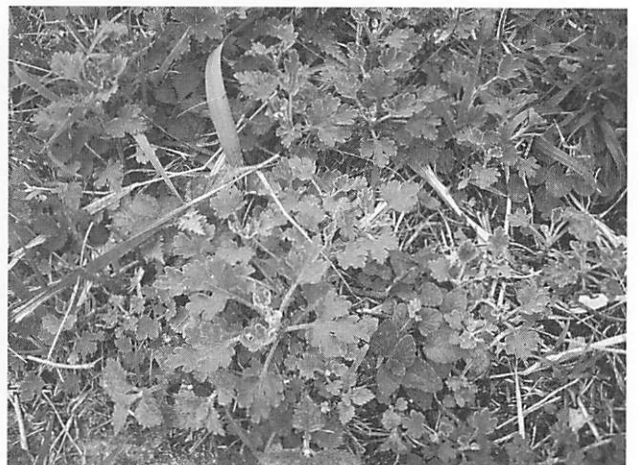
Dendranthema occidentalis-japonense ノジギク