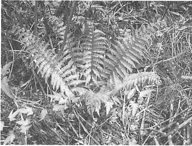
Polystichum polyblepharum イノデ