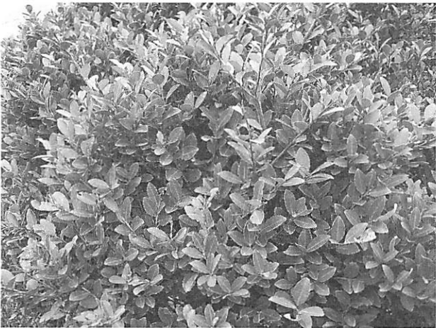
Ilex crenata var. fukasawana ツクシイヌツゲ