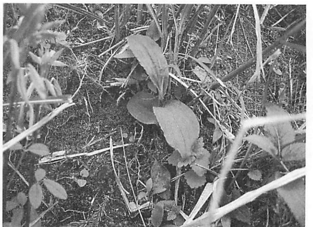
Tricyrtis affinis ヤマジノホトトギス