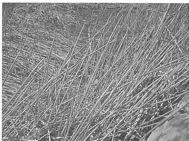
Machaerina rubiginosa アンペライ (ネビキグサ)