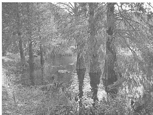
Taxodium distichum ラクウショウ (ヌマスギ)