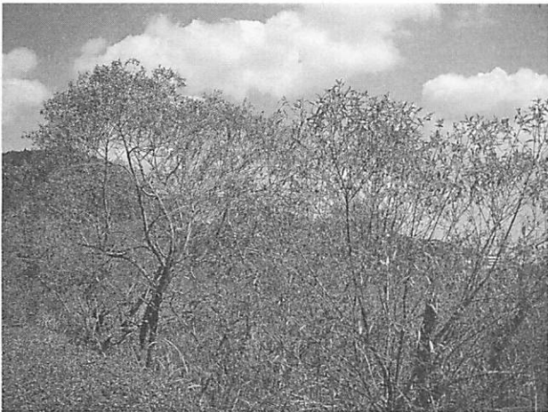
Salix eriocarpa ジャヤナギ (オオタチヤナギ)