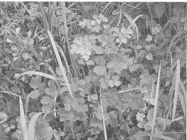
Thalicttrum minus var. hypoleucum アキカラマツ