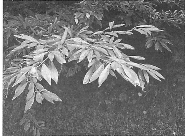
Lindera erythrocarpa カナクギノキ