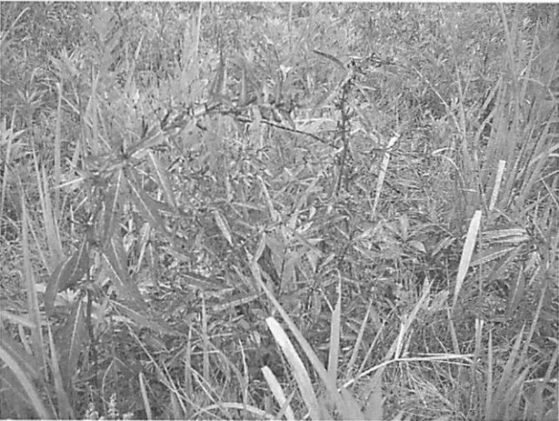
Ludwigia epilobioides チョウジタデ