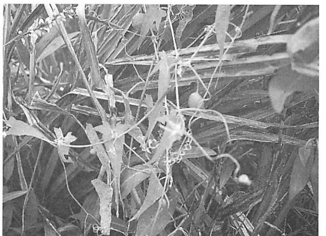
Actinostemma lobatum ゴキズル