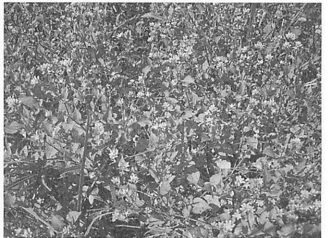
Polygonum thunbergii ミゾソバ