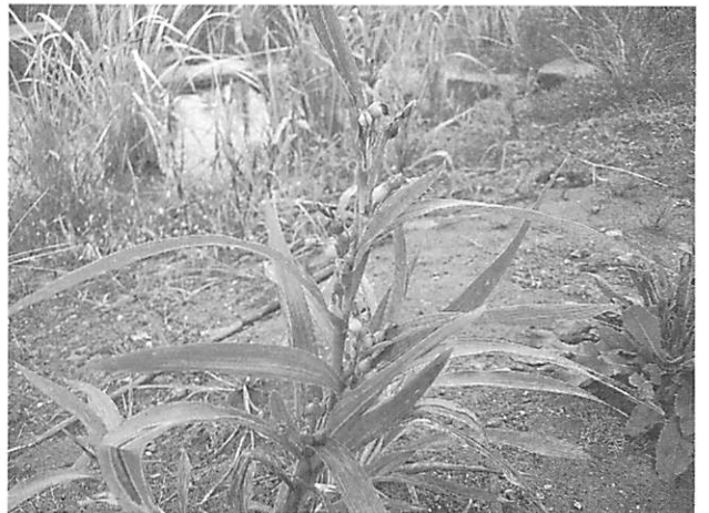
Coix lacryma-jobi ジュズダマ