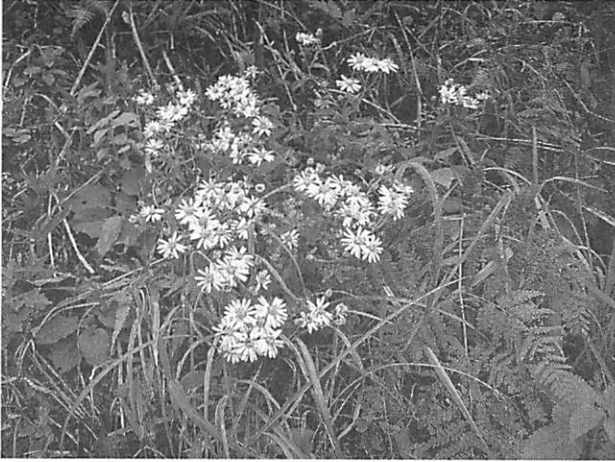
Aster satsumensis サツマシロギク