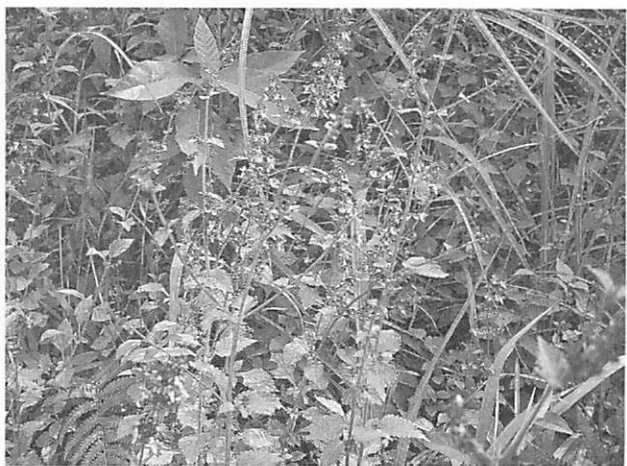
Isodon japonicas ヒキオコシ