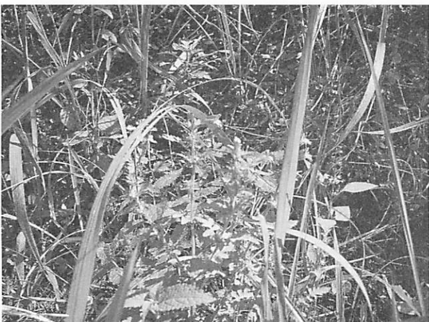
Phtheirospermum japonicum コシオガマ