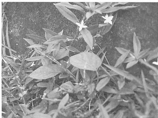
Diodia virginiana メリケンムグラ