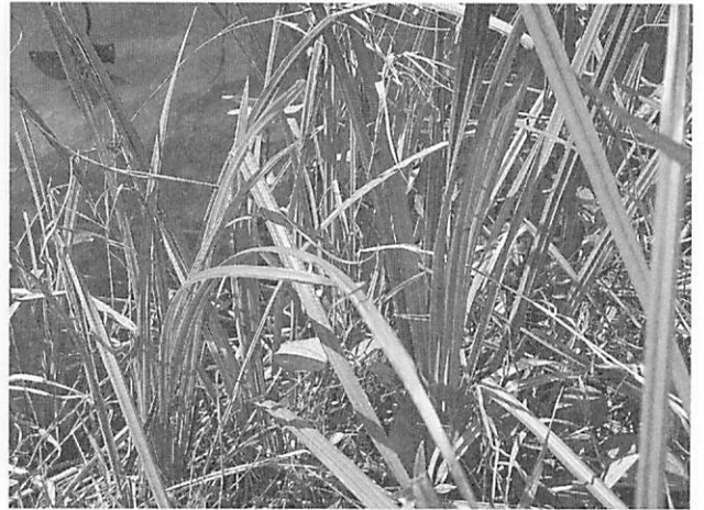
Acorus calamus var. angustatus ショウブ