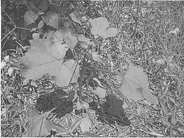
Xanthium occidentale オオオナモミ