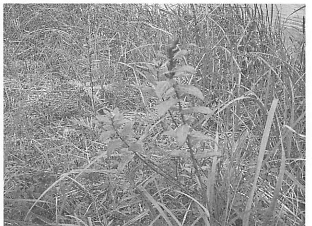
Triadenum japonicum ミズオトギリ