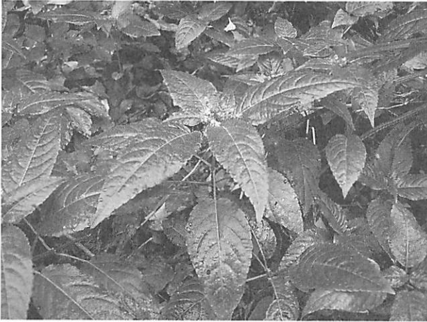
Mercurialis leiocarpa ヤマアイ