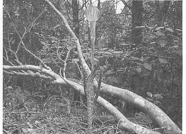
Arisaema japonicum マムシグサ