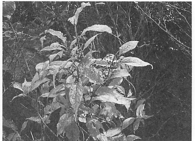
Callicarpa japonica var. luxurians オオムラサキシキブ