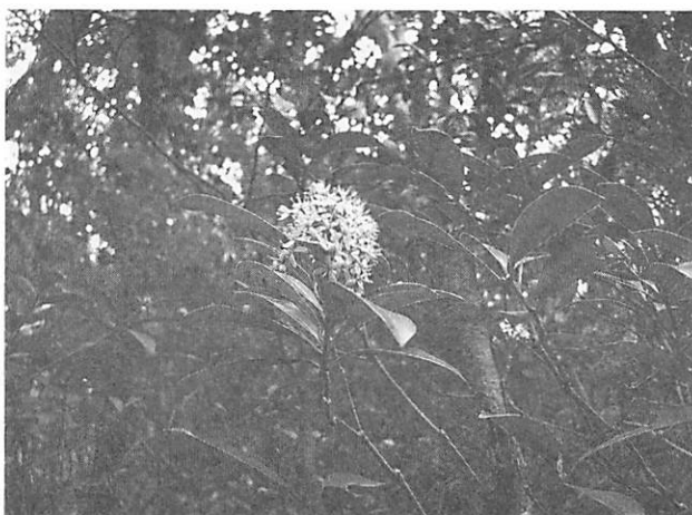
Skimmia japonica ミヤマシキミ