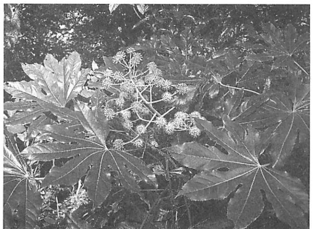
Fatsia japonica ヤツデ