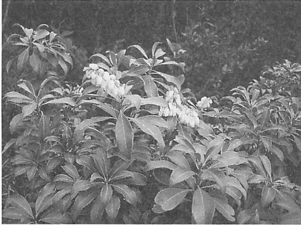
Pieris japonica アセビ