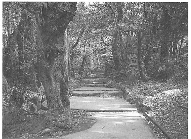
Castanopsis sieboldii in the Precincts 境内のイタジイ