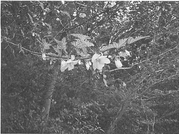
Rubus palmatus ナガバノモミジイチゴ