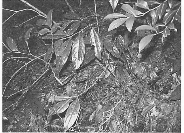
Lasianthus japonicus ルリミノキ