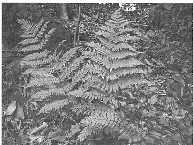
Dryopteris erythrosora ベニシダ