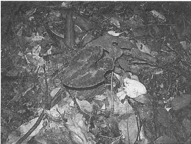
Asarum satsumense サツマアオイ