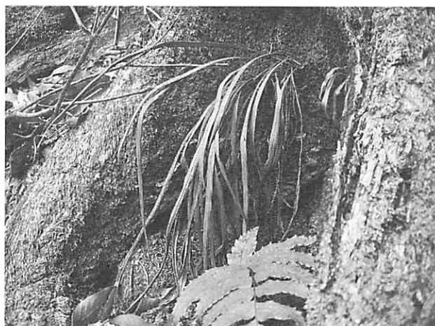
Vittaria flexuosa シシラン