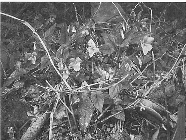
Viola ovato-oblonga ナガバナタチツボスミレ