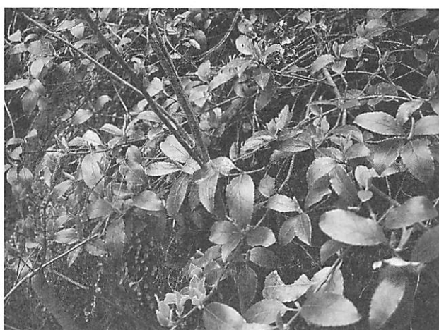
Euonymus fortunei ツルマサキ