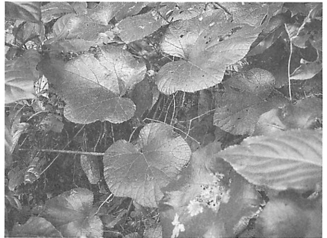
Rubus buergeri フユイチゴ