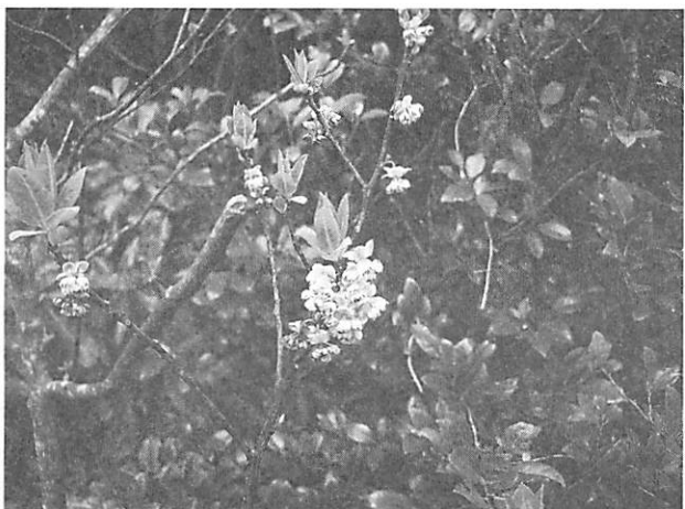
Litsea cubeba アオモジ