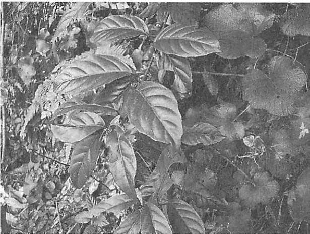
Maesa japonica イズセンリョウ