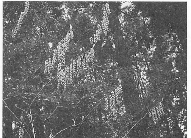
Stachyurus praecox var. lancifolius ナンバンキブシ