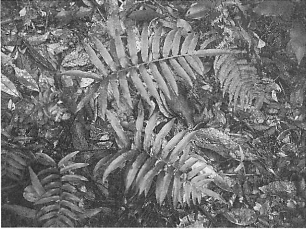
Plagiogyria japonica キジノオシダ