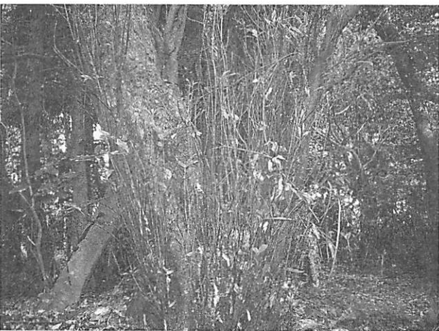
Quercus acuta アカガシ