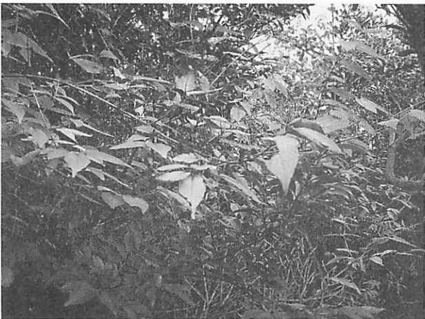
Callicarpa mollis ヤブムラサキ