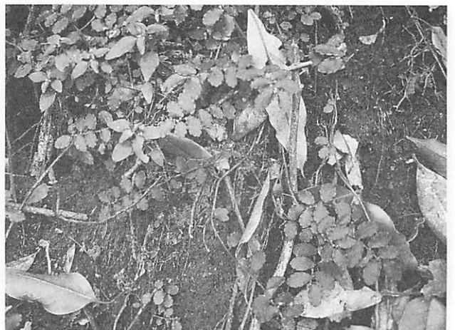
Pellionia radicans var. minima サンショウソウ