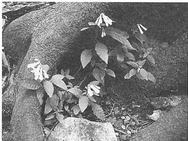
Ophiorrhiza japonica サツマイナモリ