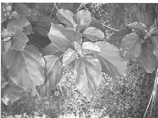
Premna corymbosa var. obtusifolia タイワンウオクサギ