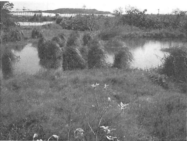
Cladium jamaicense ssp. chinense ヒトモトススキ