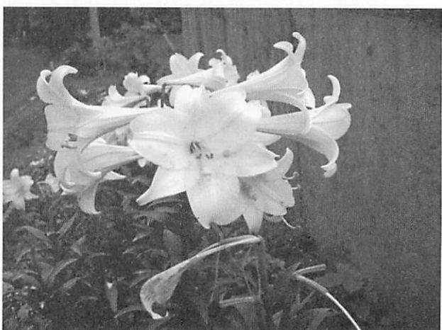
Lilium longiflorum テッポウユリ