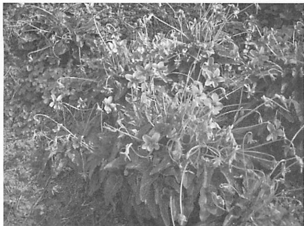
Viola yezoensis var. pseudo-japonica リュウキュウコスミレ