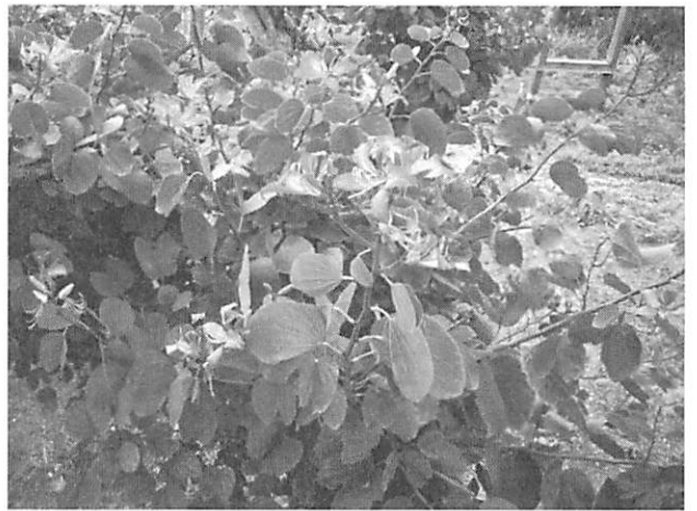
Bauhinia purpurea ムラサキモクワンジュ