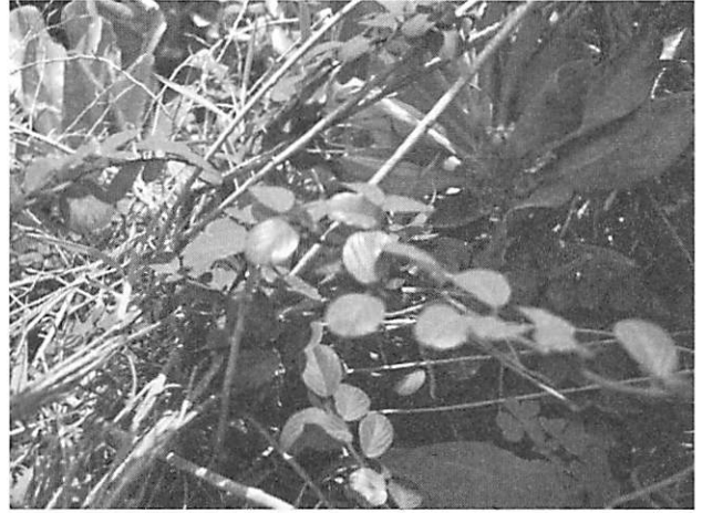
Berchemia lineate ヒメクマヤナギ