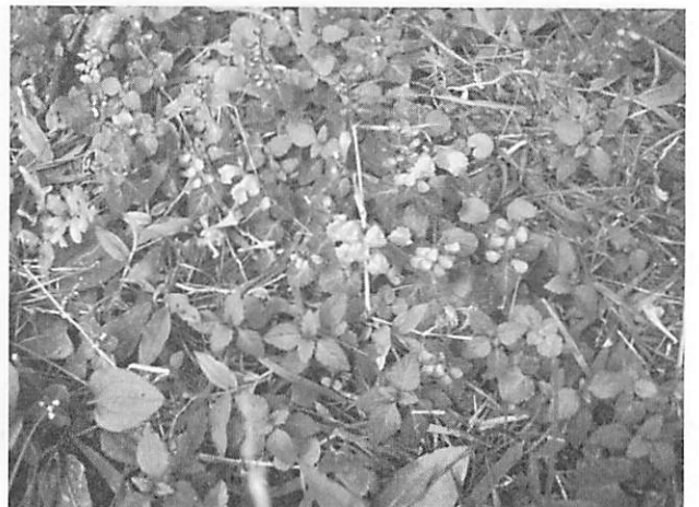
Scutellaria rubropunctata アカボシタツナミソウ