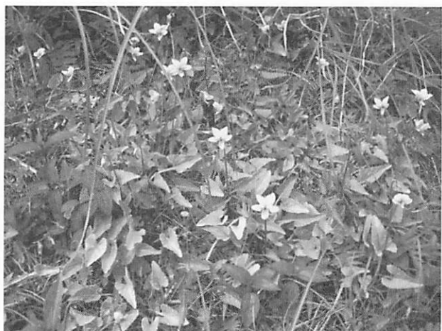
Viola betonicifolia var. oblongo-sagittata リュウキュウシロスミレ