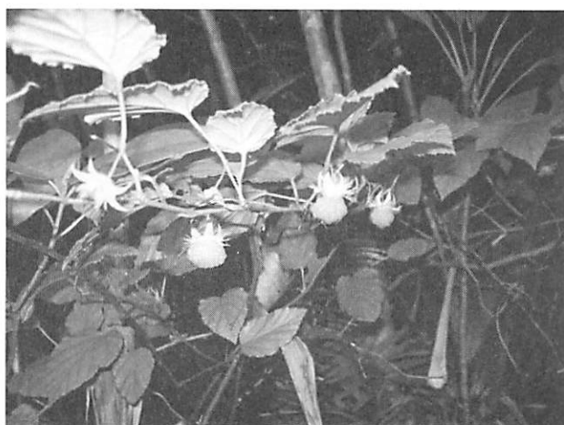
Rubus grayanus リュウキュウイチゴ