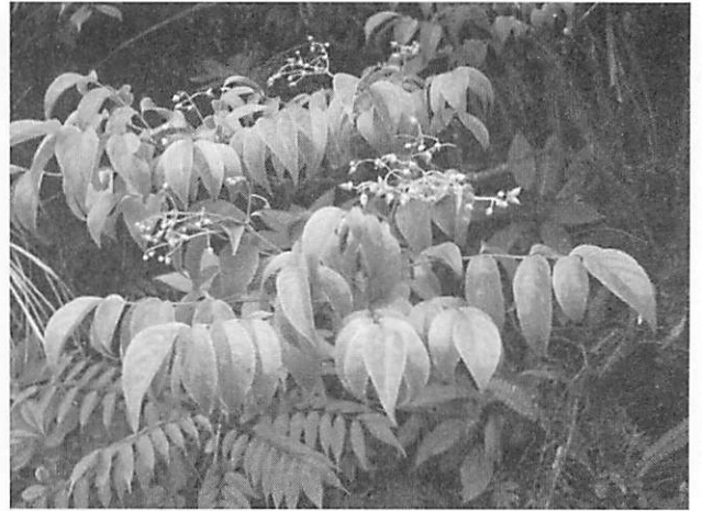
Euscaphis japonica ゴンズイ