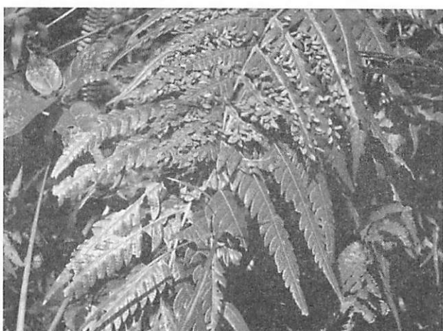
Woodwardia orientalis var. formosana ハチジョウカグマ