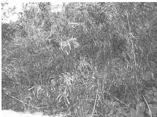
Pleioblastus linearis リュウキュウチク