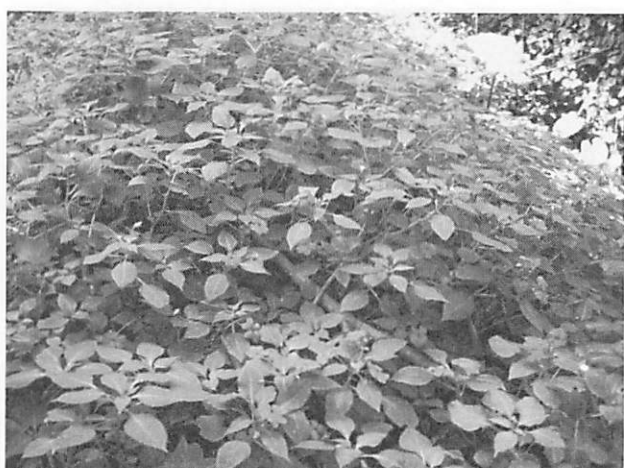
Impatiens sultani アフリカホウセンカ (インパチェンス)