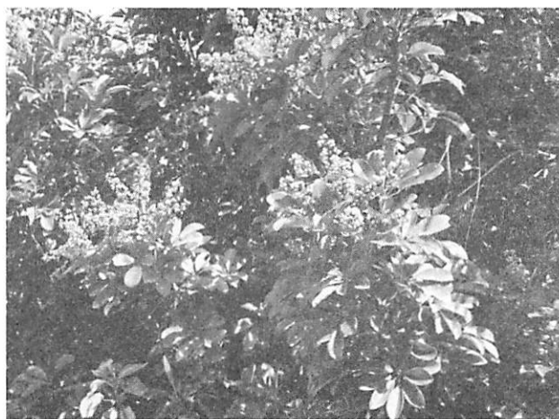
Ceiba pentandra パンヤノキ (カボック)