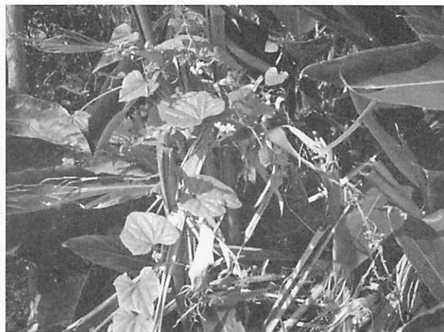
Melothria liukiuensis クロミノオキナワスズメウリ