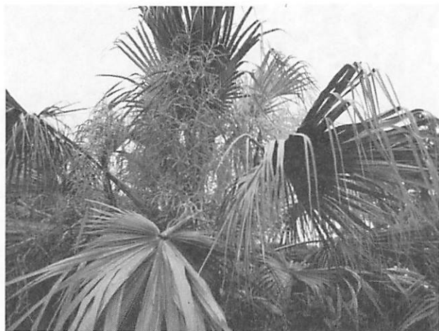
Livistona chinensis var. subglobosa ビロウ