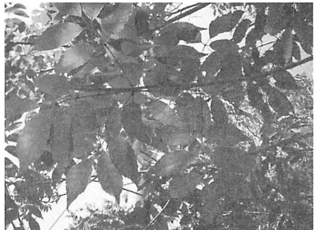
Fraxinus floribunda シマタゴ