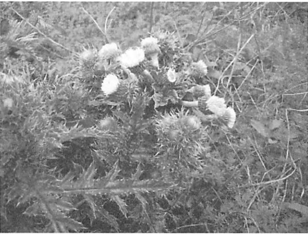
Cirsium brevicaule シマアザミ