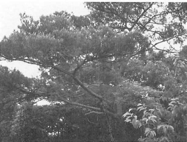
Pinus lutchuensis リュウキュウマツ