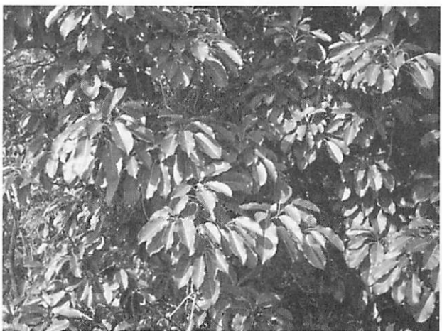
Ficus superba var. japonica アコウ