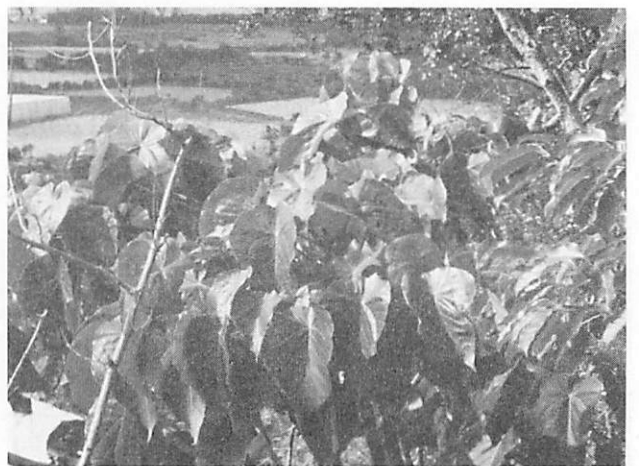
Macaranga tanarius オオバギ