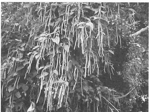
Piper kadsura フウトウカズラ