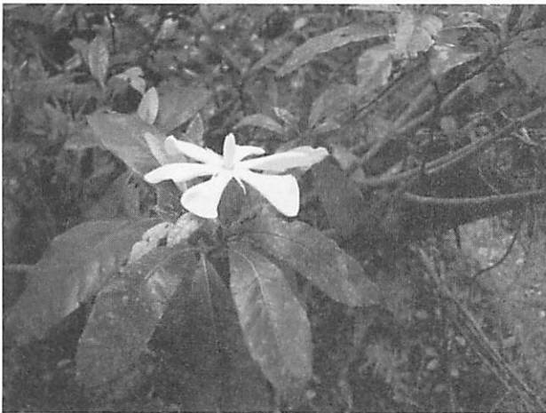
Gardenia jasminoides var. grandiflora クチナシ