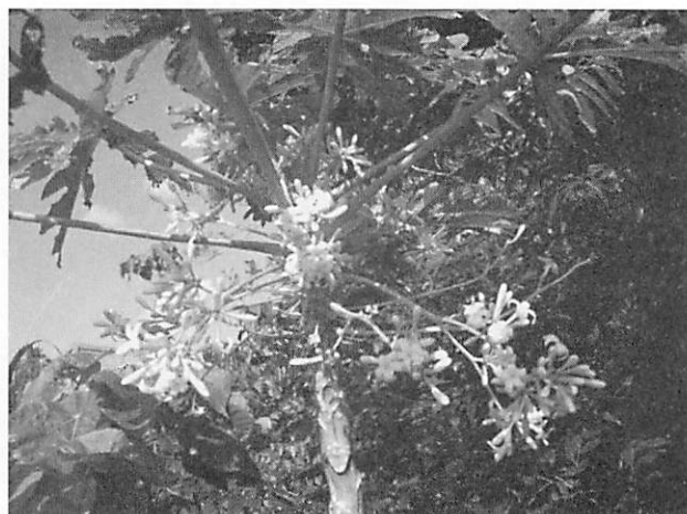
Carica papaya パパイヤ