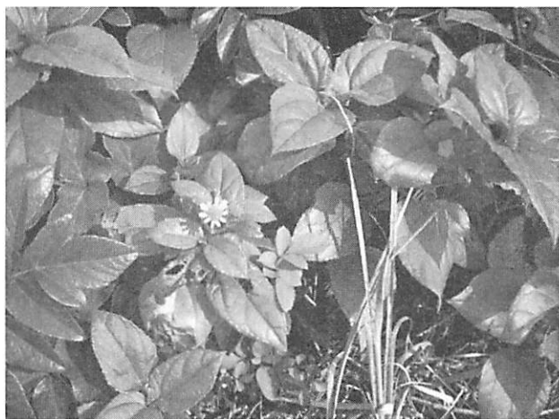
Wedelia biflora キダチハマグルマ