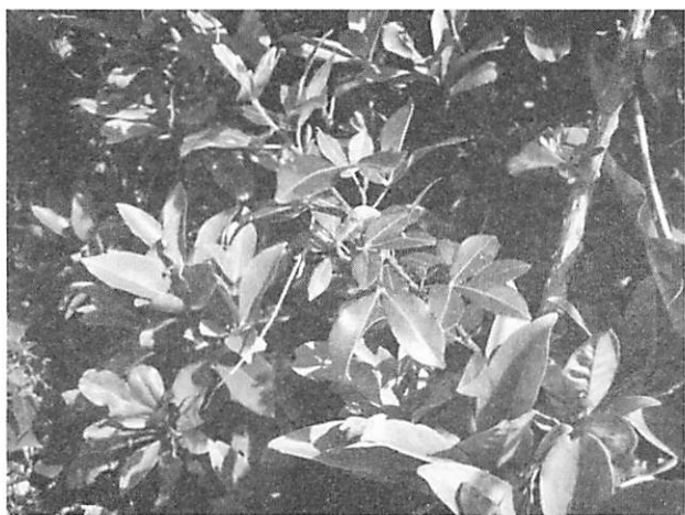
Toddaalia asiatica サルカケミカン