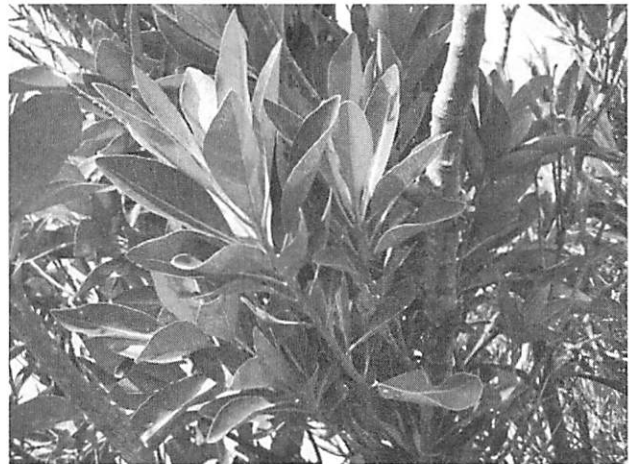
Planchonella obovata アカテツ