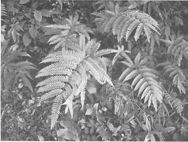
Pteris fauriei ハチジョウウシダ