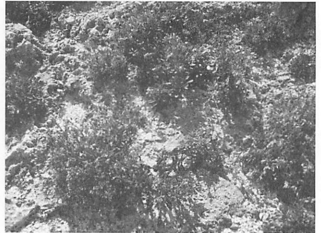
Limonium wrightii f. arbusculum イソマツ