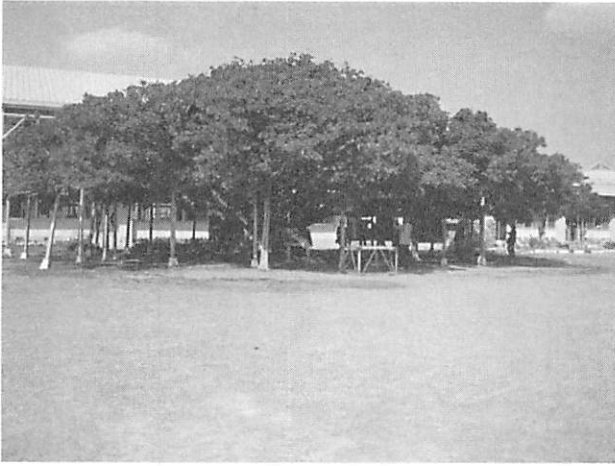
Ficus microcarpa , the largest in Japan 日本一のガジュマル