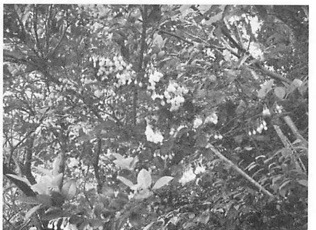
Vaccinium wrightii ギーマ