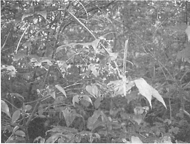
Euonymus lutchuensis リュウキュウマユミ