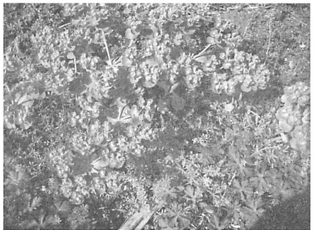
Euphorbia helioscopia トウダイグサ