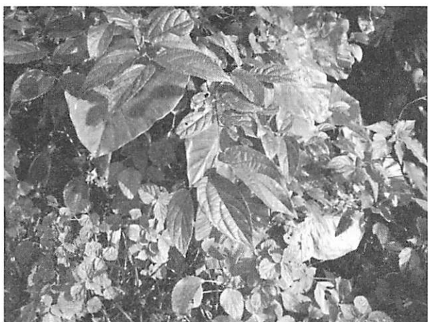
Celtis boninensis クワノハエノキ