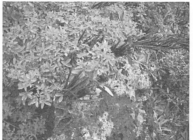
Melilotus suaveolens シナガワハギ