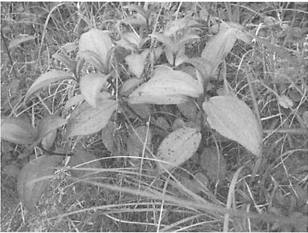
Melastoma candidum ノボタン