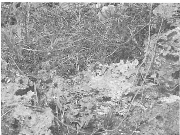
Cassytha filiformis スナヅル