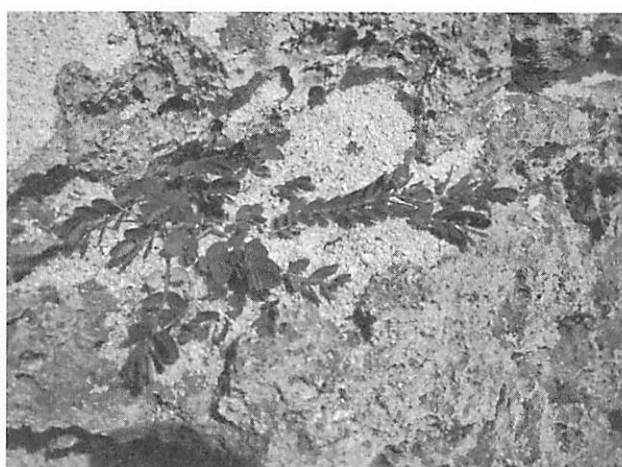
Euphorbia chamissonis ハマタイゲキ