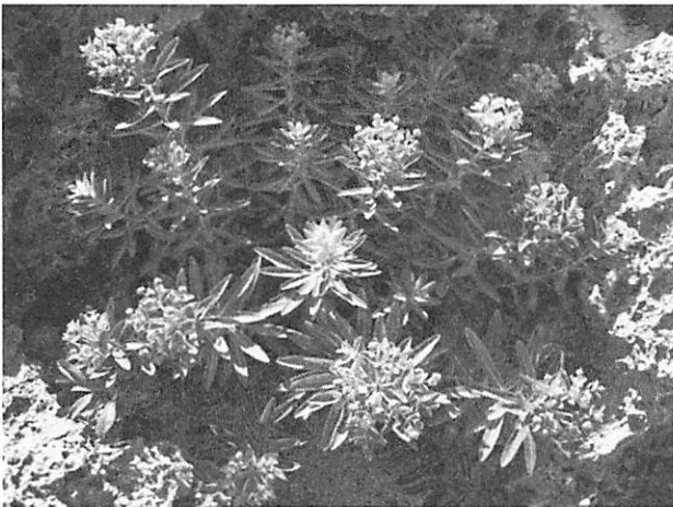
Euphorbia jolkinii イワタイゲキ