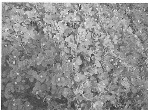
Medicago lupulina コメツブウマゴヤシ