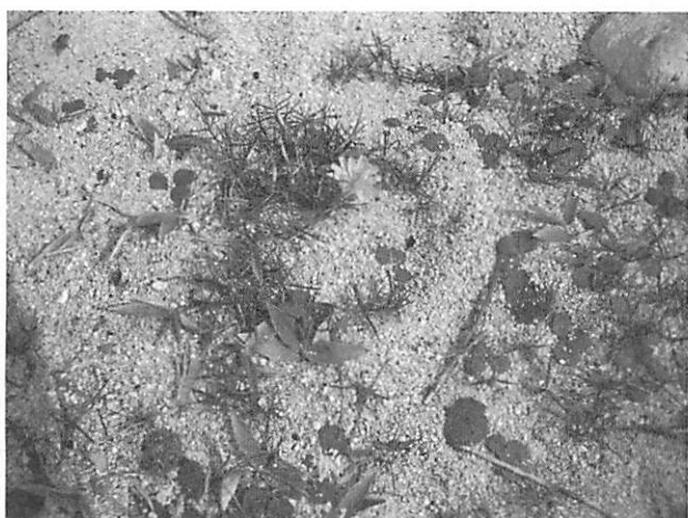
Ixeris repens ハマニガナ