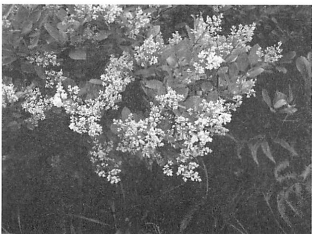
Ligustrum japonicum ネズミモチ