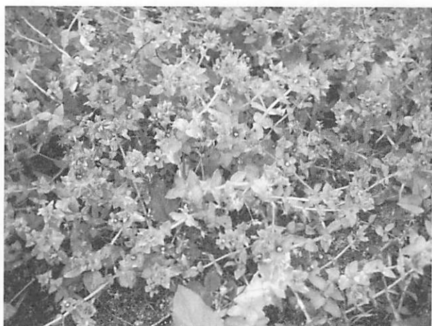
Anagallis arvensis f. coerulea ルリハコベ