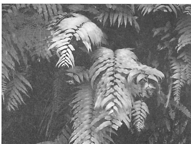
Nephrolepis biserrata ホウビカンジュ