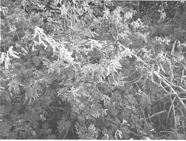
Corydalis tashiroi シマキケマン