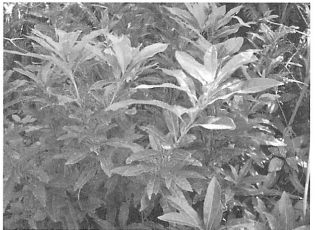
Myrica rubra ヤマモモ