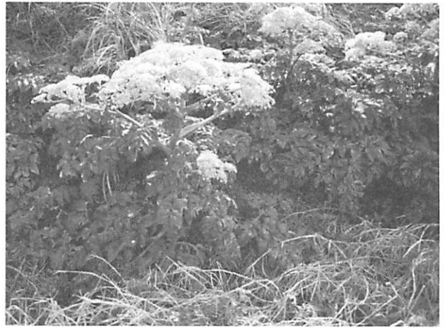
Angelica japonica ハマウド