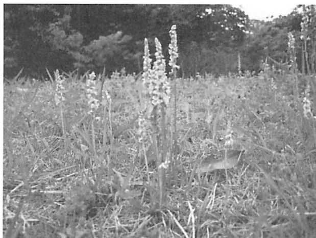
Spiranthes sinensis ナンゴクネジバナ