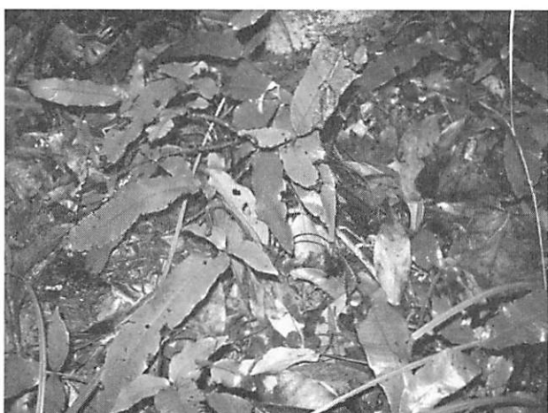
Thelypteris triphylla ヒトツバコウモリシダ