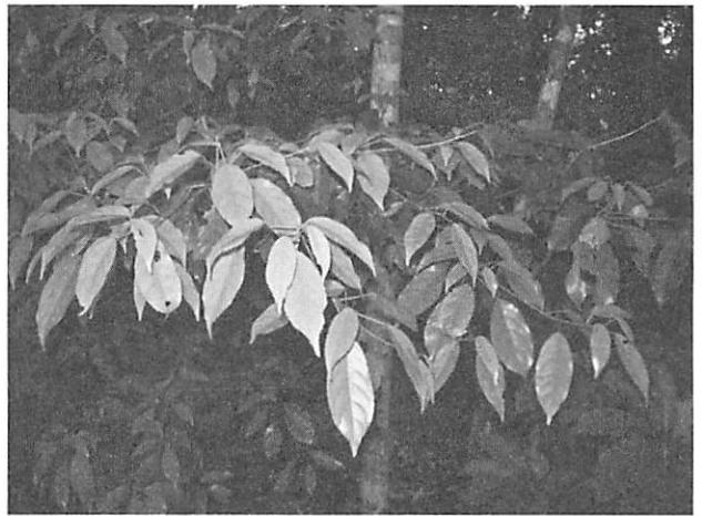
Elaeocarpus japonicus コバンモチ