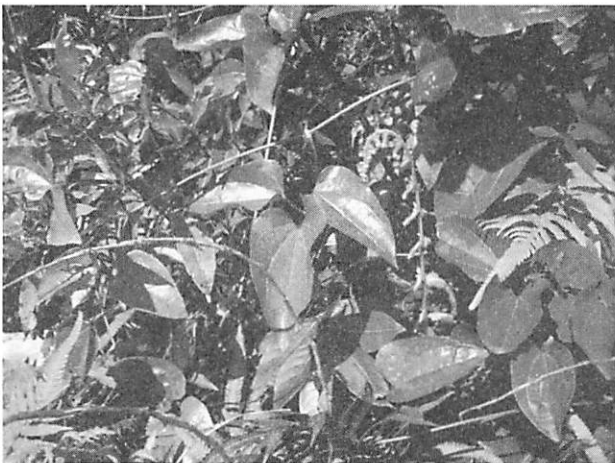
Clematis tashiroi ヤエヤマセンニンソウ