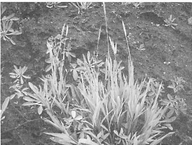
Ischaemum aureum ハナカモノハシ