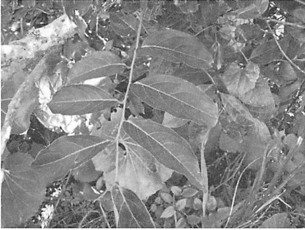
Glochidion zeylanicum カキバカンコノキ