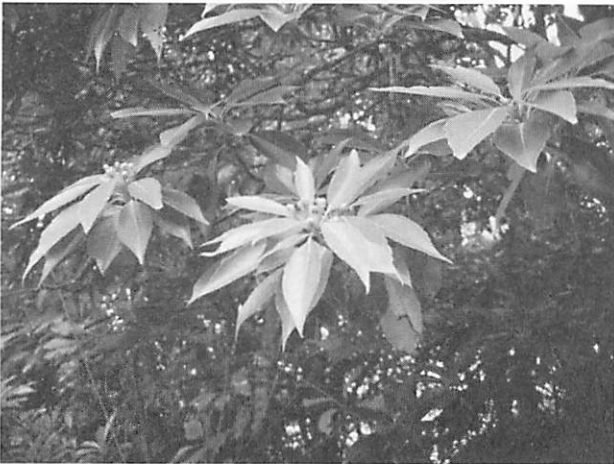
Schima wallichii ssp. Liukiensis イジュ