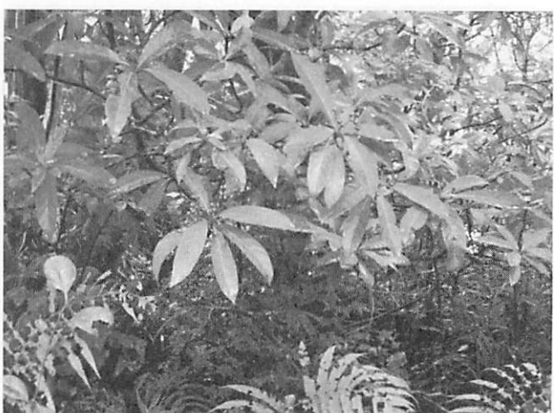
Psychotria rubra ボチョウジ