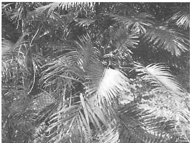
Arenga tremula var. engleri クロツグ