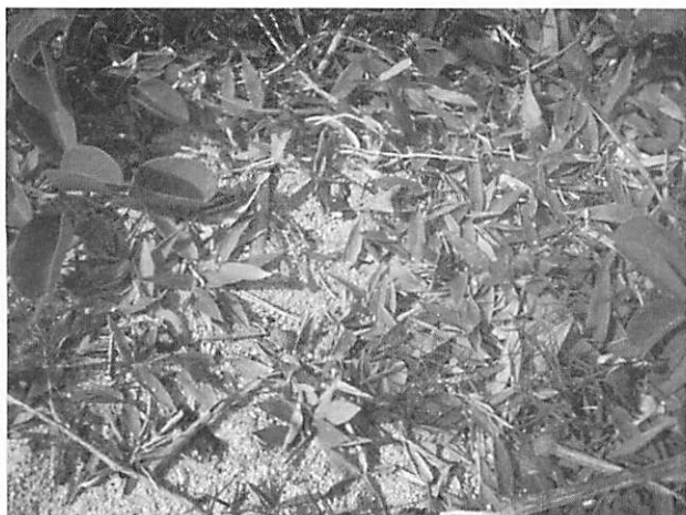
Thuarea involuta クロイワザサ