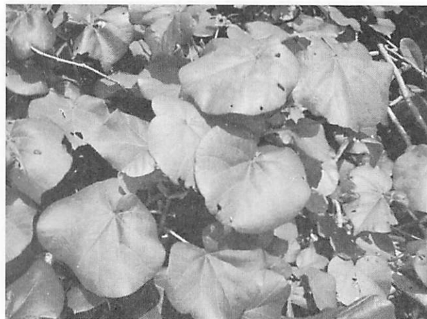
Hibiscus tiliaceus オオハマボウ